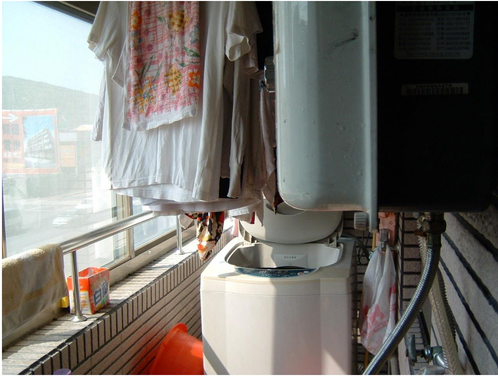
RF 式熱水器裝設於加蓋陽台範例圖