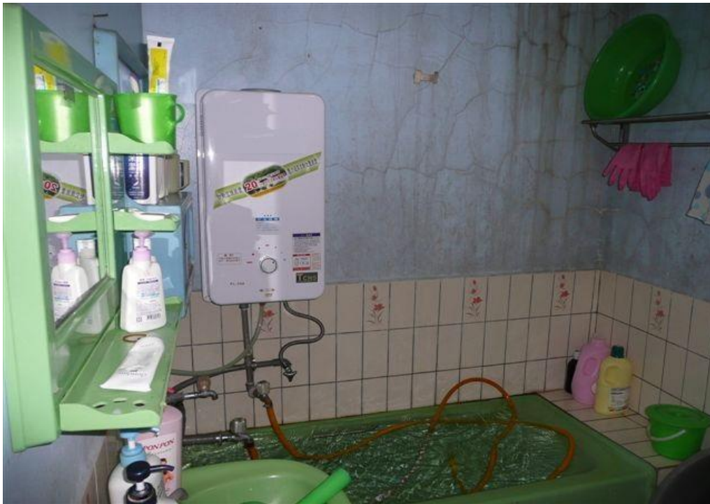
CF 式熱水器未裝設排氣管範例圖