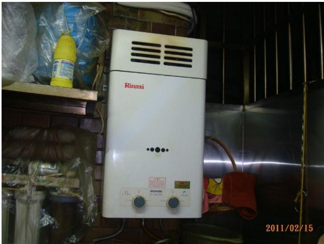
RF 式熱水器裝設於屋內範例圖