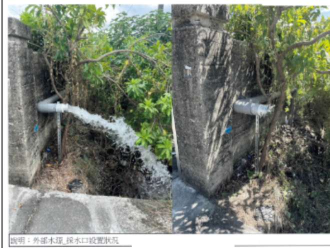
說明：外部水源_採水口設置狀況