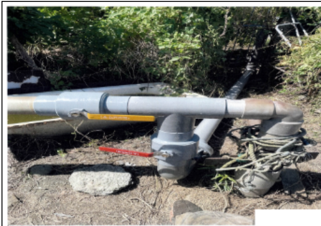
說明：外部水源_地下水井加壓供水裝置