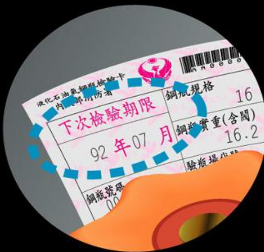
2.超過下次檢驗 期限仍未送檢