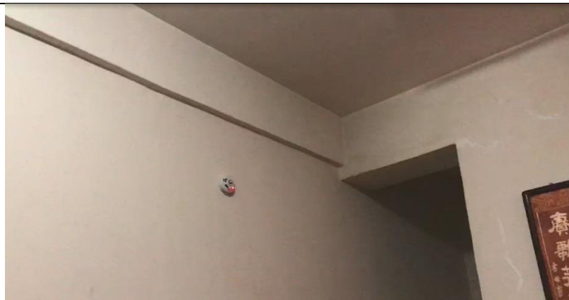
住警器裝設位置圖