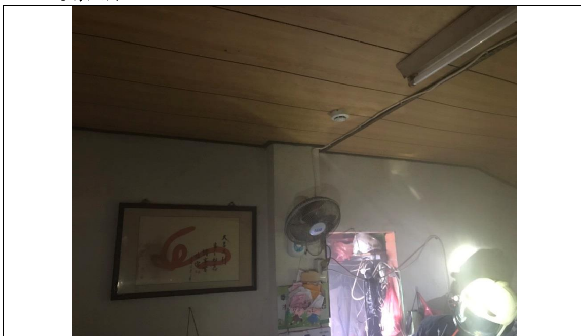
圖一：住警器裝設位置