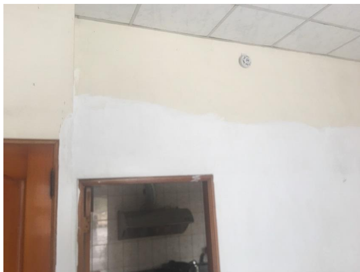
圖一：住警器裝設位置