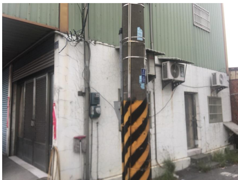
圖二：起火建築物外觀