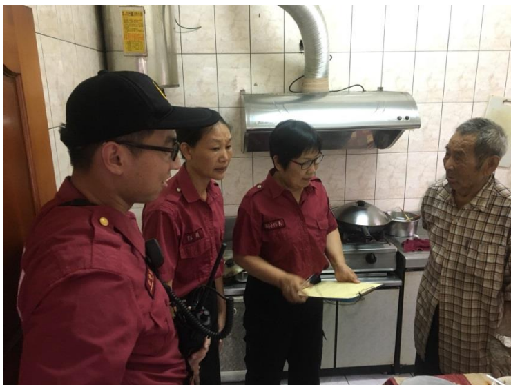
社區居家安全訪視