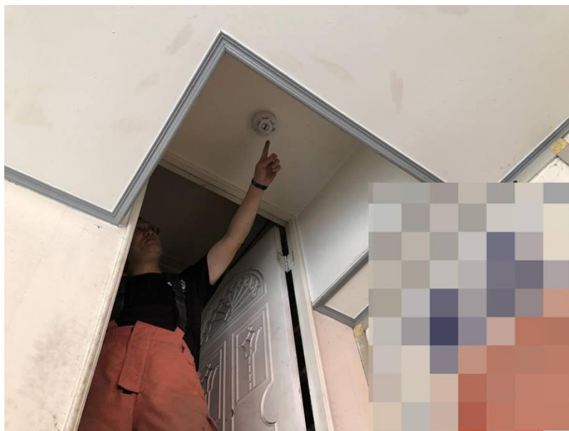
圖一：住警器裝設位置