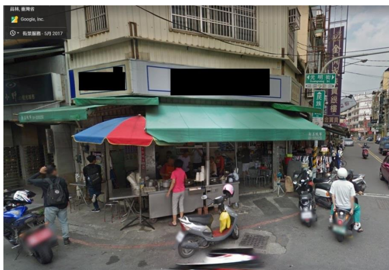
圖二：起火建築物外觀