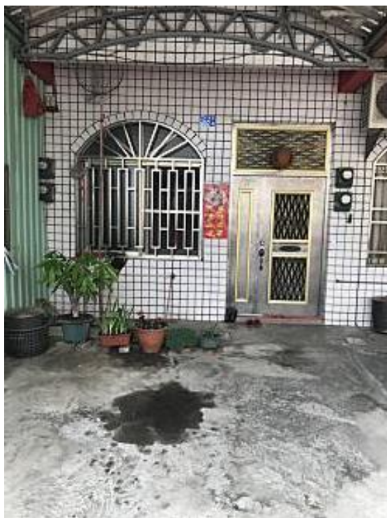
圖一：起火建築物外觀