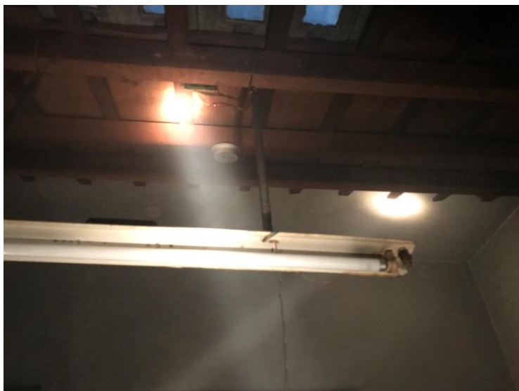
圖一：住警器裝設位置