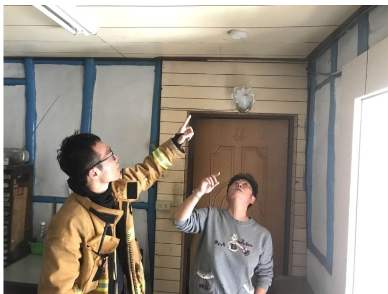
圖三：住警器裝設位置