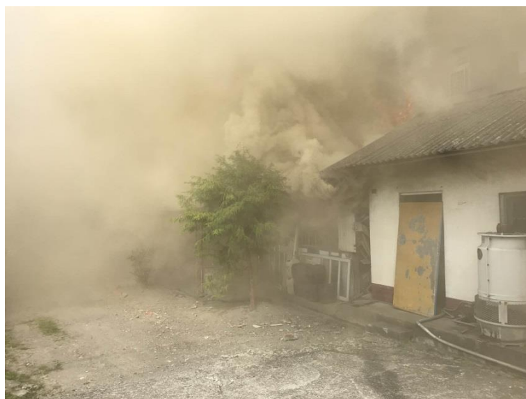
圖一：起火建築物外觀