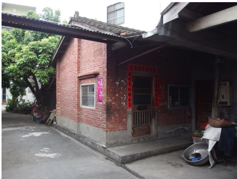
圖一：起火建築物外觀